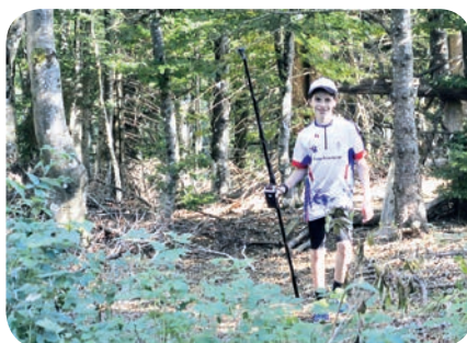
Renard en action