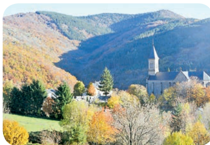
Village de Dourbies

Les retours sont joyeux et nous nous retrouvons pour de radieuses promesses d'avenir autour du verre de l'amitié.