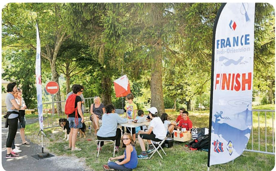
Dourbies camp de base

A dix heures, sous un soleil radieux, tout est en place et les premiers orienteurs viennent s'initier à la recherche des balises.