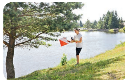
Lac de Camprieu

La carte d'orientation est très précise et la navigation est délicate sur ce site, avec de grands espaces dégagés en forêt, des zones plus encombrées par les résidus d'exploitation forestière et des passages de chaos rocheux sous couvert qui rendent la course plus complexe et plus attrayante.