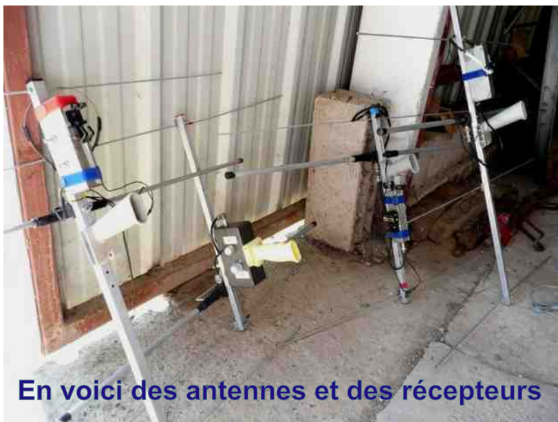
En voici des antennes et des récepteurs

Je dirais là qu'il s'agit d'un vaste chapitre, dans lequel je n'entrerais que très légèrement dans les détails. Chacun possédant « son antenne » ... « celle qui va bien » ... « celle qui gagne » ... dans le 60 nous avons les débroussailleuses comme disaient certains... Mais si, vous savez, les antennes style HB9CV avec lesquelles on rentre à fond dans les broussailles l'antenne en avant, histoire de tracer la route quoi ! Maintenant la plupart des participants utilisent des yagis légères et peu encombrantes. Parlons maintenant d'une caractéristique importante que