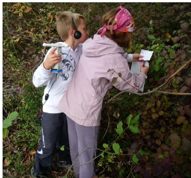
Premières découvertes et premier pointage !!!!

La découverte de la balise sera validée par le poinçonnage de la carte à l'aide d'une pince codée. Contrairement aux courses traditionnelles le coureur ne verra aucun fanion, seule la pince sera visible. Cette pince sera accrochée à une branche ou un piquet. La ligne d'arrivée sera au même endroit que le départ. Ces règles de base devront être respectées partout et par tous. En effet, si des coureurs de régions voisines participent aux compétitions que vous organisez, ce qui est hautement souhaitable, tout le monde se retrouvera dans des pratiques communes. Il est vrai que les pratiquants confirmés et assidus de ce sport nature radioamateur en connaissent les règles et s'attendent à trouver la même organisation sur toutes les épreuves auxquelles ils participent.