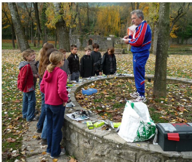
F6HYT donne les explications avant le départ (fête de la Science à Brissac - 34)

Nous proposons le tableau des signaux émis suivant. Nous avons déterminé seuls le choix des lettres générées parce que nous ne détenions pas de précisions sur le sujet. Nous nous sommes inspirés de ce que nous pratiquons actuellement afin de ne pas troubler les habitudes de tous. La première émettra un trait puis un point, la seconde un trait deux points et cela jusqu'à cinq points pour la cinquième balise, la sixième balise deux traits un point, la septième deux traits deux points jusqu'à cinq points, la dixième deux traits cinq points, puis s'il y a lieu, la onzième trois trait un point, la douzième trois trait deux points et cela jusqu'à la quinzième. Le nombre de quinze n'est pas une obligation, il sera fonction de vos participants et de vos souhaits.