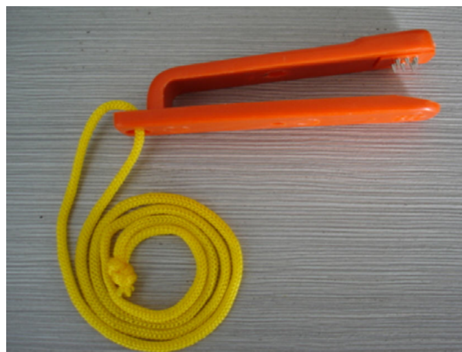
La pince de pointage codé qui justifie la découverte de la balise

La découverte de la balise sera validée par le poinçonnage de la carte à l'aide d'une pince codée. Contrairement aux courses traditionnelles le coureur ne verra aucun fanion, seule la pince sera visible. Cette pince sera accrochée à une branche ou un piquet. La ligne d'arrivée sera au même endroit que le départ. Ces règles de base devront être respectées partout et par tous. En effet, si des coureurs de régions voisines participent aux compétitions que vous organisez, ce qui est hautement souhaitable, tout le monde se retrouvera dans des pratiques communes. Il est vrai que les pratiquants confirmés et assidus de ce sport nature radioamateur en connaissent les règles et s'attendent à trouver la même organisation sur toutes les épreuves auxquelles ils participent.