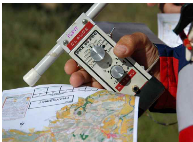
Récepteurs 80 m

Les accompagnants ne seront pas laissés pour compte, l'organisateur leur dévoilera quelques endroits caractéristiques donc facilement identifiables sur le terrain leur donnant un but de promenade avant de les faire rejoindre la ligne d'arrivée pour applaudir leurs coureurs.