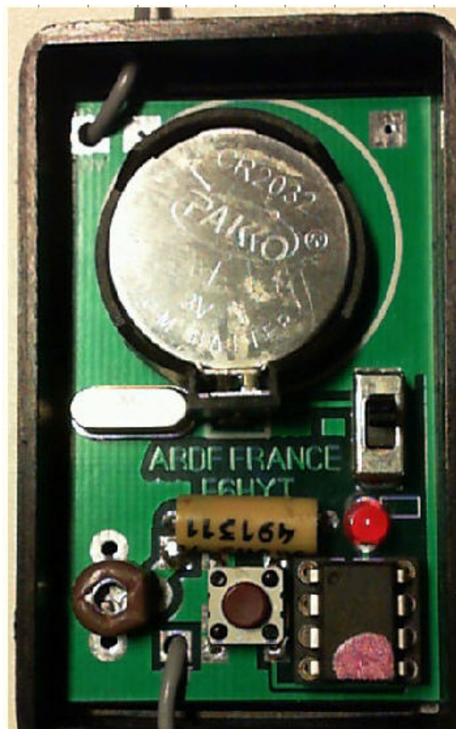
Micro balise de Toporadio

Les accompagnants ne seront pas laissés pour compte, l'organisateur leur dévoilera quelques endroits caractéristiques donc facilement identifiables sur le terrain leur donnant un but de promenade avant de les faire rejoindre la ligne d'arrivée pour applaudir leurs coureurs.